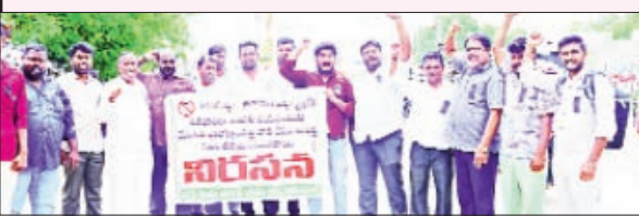
అలేరు మే 29 ప్రభాతవార్త