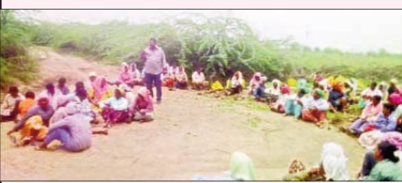
అలేరు మే 29 ప్రభాతవార్త.